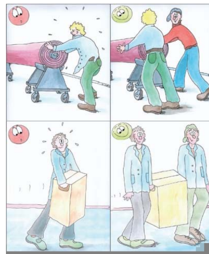
Bild 2: Unterstützung des Heben und Tragens durch zusätzliche Träger