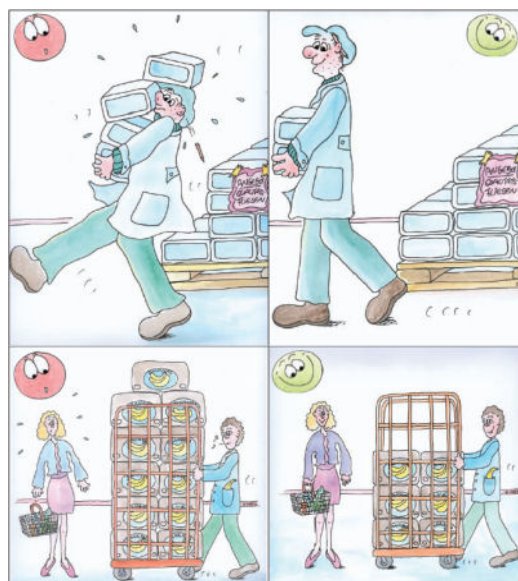
Bild 8: Beim Schieben des Rollcontainers sollte darauf geachtet werden, dass die Sicht frei ist!