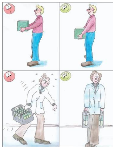
Bild 5: Tragen Sie Lasten möglichst Körpernah und halten Sie Ihren Rücken gerade!

Beim Heben und Tragen sollten grundsätzlich ruckartige Bewegungen und Verdrehungen des Oberkörpers vermieden werden, damit es nicht zu Belastungen der Bandscheiben kommt. Angemessen und richtig ist nur ein Drehen aus dem ganzen Körper bei der sich auch die Stellung der Füße ändert.