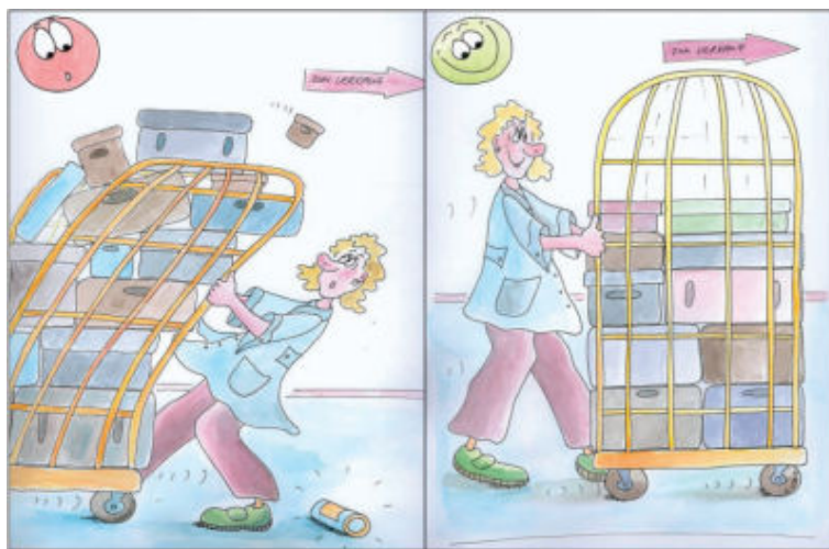
Bild 7: Rollcontainer sollten möglichst geschoben werden!

Rollcontainer werden im Einzelhandel oft eingesetzt und sind eines der unfallträchtigsten Transportmittel. Nach Aussage der BGHW haben Unfälle mit Rollcontainern ihre Ursache vornehmlich in Mängeln am Rollbehälter selbst, in unzureichenden Verkehrswegen (Hindernissen, etc.), in ungeeignetem Schuhwerk sowie in Mängeln im Betriebsablauf.