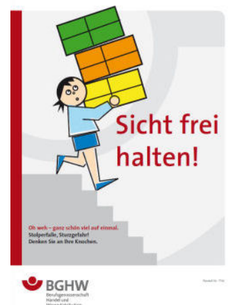
Bild 6: Sicht frei halten!

Auch sollte das Heben und Tragen immer nur bei freier Sicht erfolgen, so dass Wegeunfälle verhindert werden.