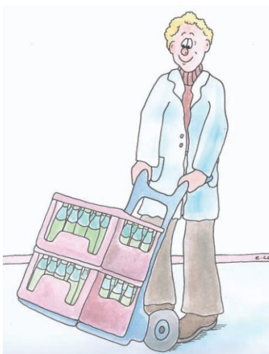
Bild 1: Benutzen Sie Tragehilfen! Zum Beispiel können Getränkekisten transportiert werden. Quelle: BGHW-Merkblatt: „Heben und Tragen“ (Bestell-Nr. M 103)