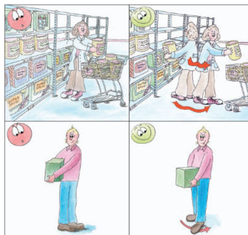
Bild 4: Vermeiden Sie beim Heben das Verdrehen des Oberkörpers und ruckartige Bewegungen!